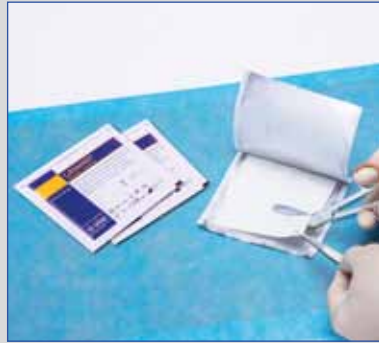
Sehr gutes Zuschneiden, Drapieren und Tamponieren möglich