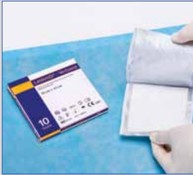
Gebrauchsfertige feuchte Wundauflage zur direkten Anwendung