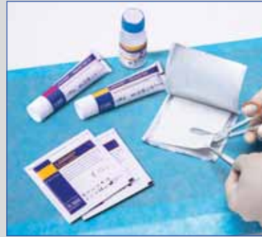
Zusätzliche Befeuchtung mit LAVANID® Wundgel möglich (bei trockenen Wunden)